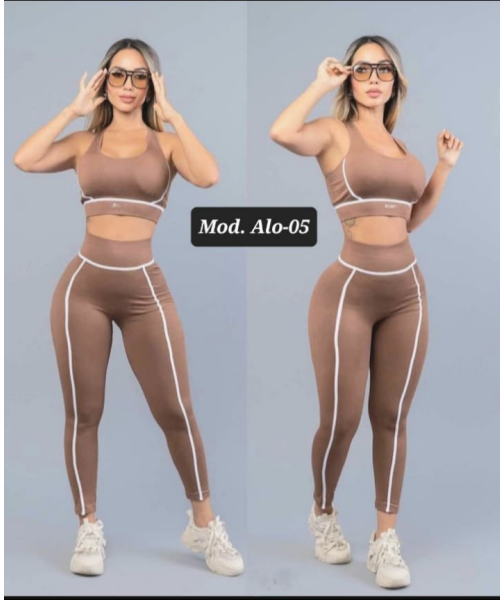
CONJUNTO DEPORTIVO ALO-05 CAQUI UNITALLA (30 A 34)