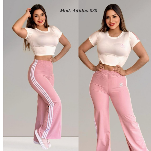
ADIDAS-030 ROSA WATERPROOF UNITALLA (32 A 34).