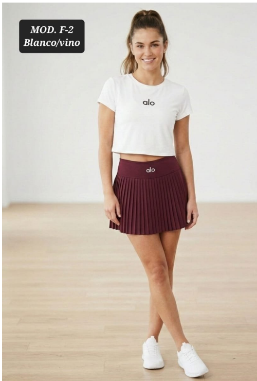
CONJ. DAMA MOD F-2 UNITALLA BLANCO/VINO