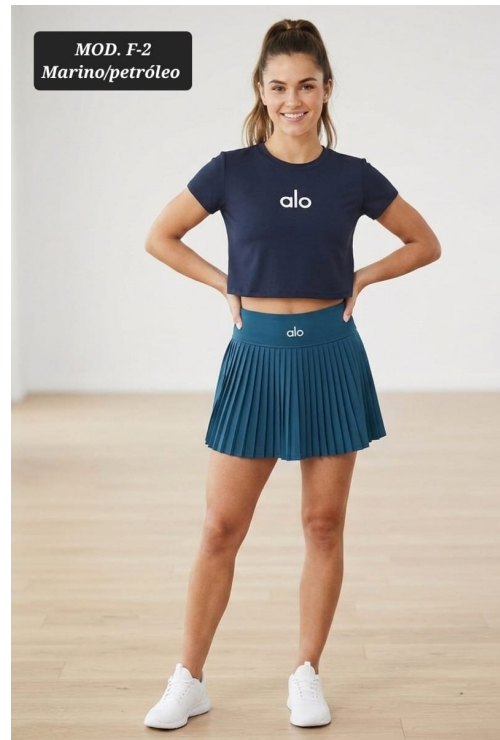
CONJ. DAMA MOD F-2 UNITALLA MARINO/PETROLEO