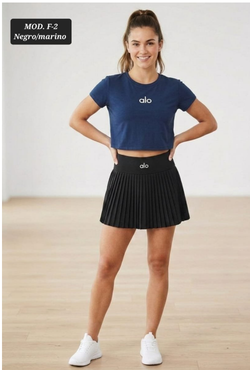
CONJ. DAMA MOD F-2 UNITALLA NEGRO/MARINO