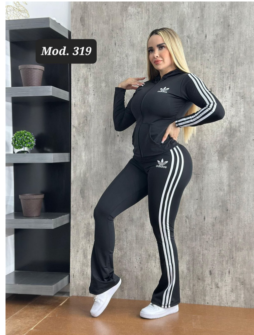
CONJ. DEPORTIVO LICRA MOD. 319 UNITALLA