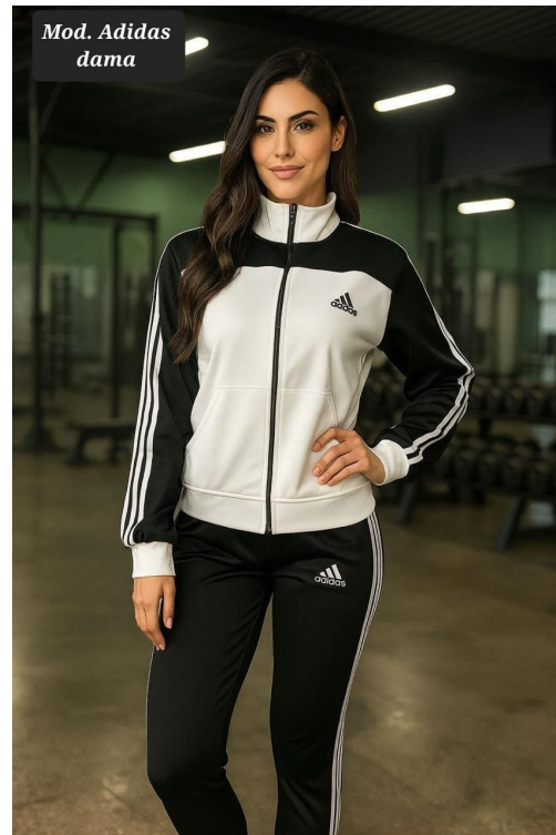
PANTS DE DAMA MOD. ADIDAS BLANCO-NEGRO UNITALLA (30-34)