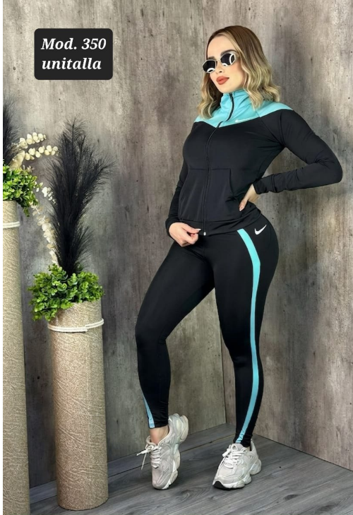
CONJ. DEPORTIVO LICRA MOD. 350