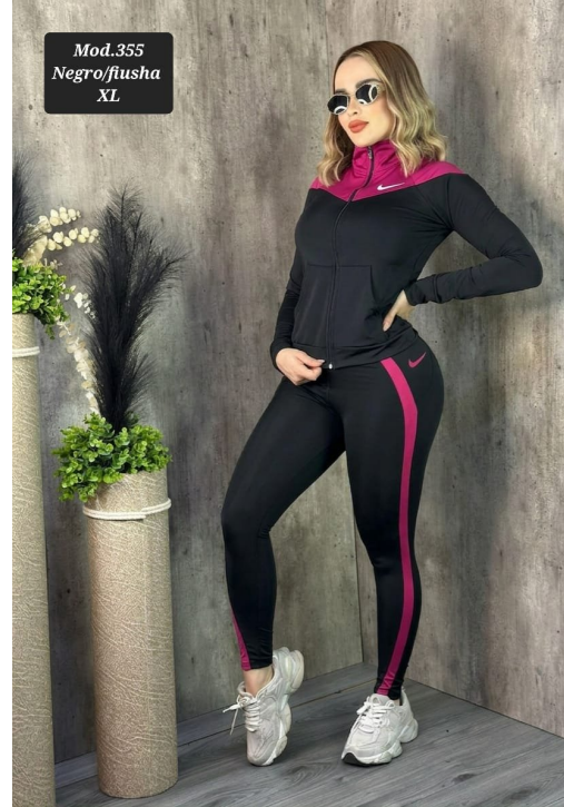
CONJ. DEPORTIVO LICRA MOD. 355 XL