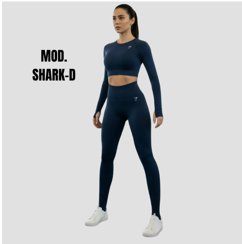
CONJ. DEPORTIVO TOP MOD. SHARK-D UNITALLA (30-34)