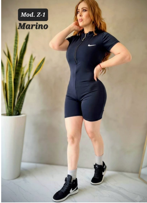
MONO SHORT DAMA MOD. Z-1 UNITALLA