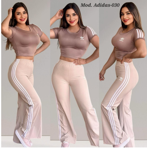
ADIDAS-030 CAQUI WATERPROOF UNITALLA (32 A 34).