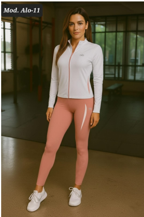
CONJUNTO ALO-11 UNITALLA (30-34)