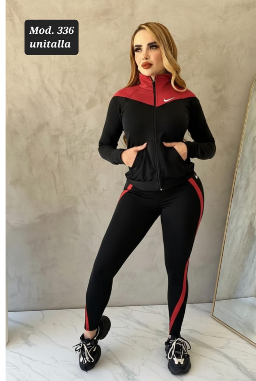
CONJ. DEPORTIVO LICRA MOD. 336 UNITALLA