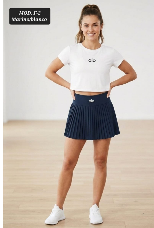
CONJ. DAMA MOD F-2 UNITALLA MARINO/BLANCO