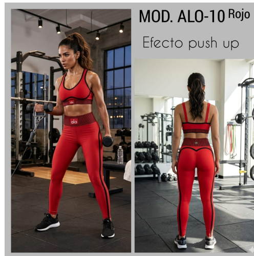
CONJ. DEPORTIVO TOP MOD. ALO-10 UNITALLA ROJO