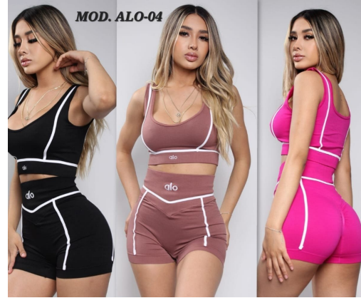
CONJUNTO DEPORTIVO ALO-04 UNITALLA