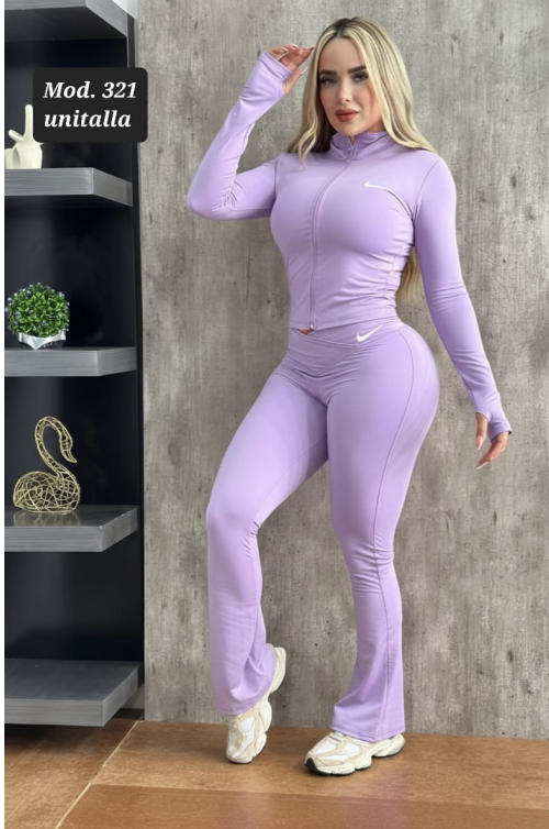
CONJ. DEPORTIVO LICRA MOD. 321 UNITALLA