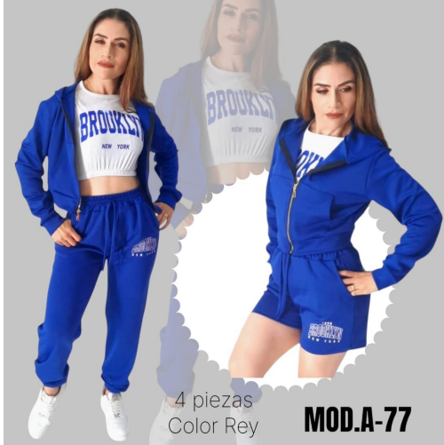
CONJUNTO A-77 REY 4 PIEZAS UNITALLA (30 A 34).