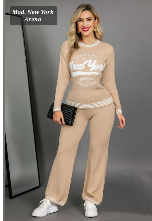
CONJUNTO DE DAMA IMPORTACION MOD. NEW YORK UNITALLA 32-36